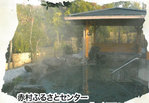
赤村ふるさとセンター 源じいの森温泉

季節ごと表情を変える雄大な自然に囲まれて、豊富に湧き出る天然温泉は多数の効能があり皆さんの身体を癒してくれます。