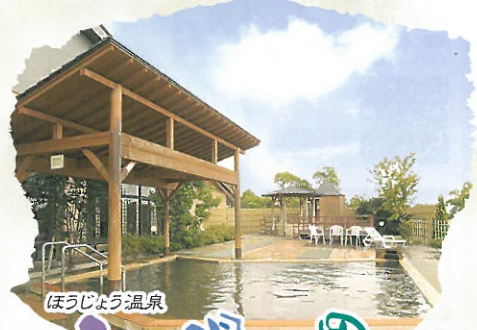
ほうじょう温泉 ふじ湯の里 ふじゆのさと

源泉掛け流しの、ほうじょう温泉ふじ湯の里。源泉から注がれる効能豊かな湯を心ゆくまでお楽しみ下さい。