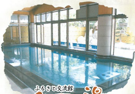
ふるさと交流館 白王の湯 ひのう

「ゆとりある空間づくり」をテーマにすべての人にやさしいユニバーサルデザインとバリアフリー構造を基本にした、福祉環境の高い施設です。