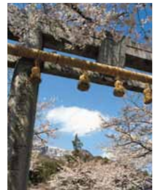
C-3 香春神社の桜 (香春町) 香春町の桜の名所。香春岳一ノ岳をバックに素晴らしい花を咲かせ、大勢の花見客でにぎわいます。