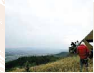
B-2 日王山自然公園 (福智町) 森林浴ができる遊歩道や吊り橋などがあり、自然を満喫できる公園です。