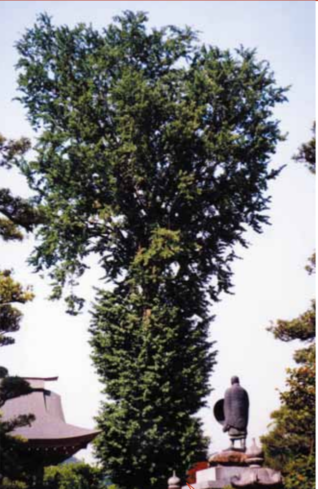
D-4 正福寺の大銀杏 (赤村) 高さ約20m、幹の直径約1.5mの巨木。