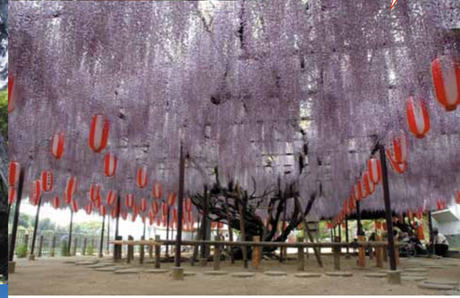
B-2 定禅寺の藤 (福智町) 県指定天然記念物 樹齢500年以上といわれる藤。幹周囲が約4m、四方に伸びた枝は800mにおよび、毎年5月には1.2~1.5mの見事な花が咲き誇ります。「迎接の藤」と呼ばれています。