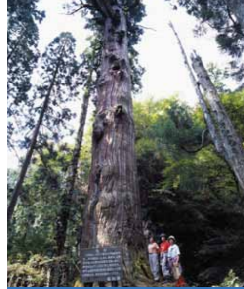
G-5 鬼杉 (添田町) 国指定天然記念物 高さ38m、幹周12.4m、指定樹齢約1200年で、福岡県内でも最大最古の巨木。林野庁発表の「森の巨人たち百選」にも選ばれたほど。もともとは57mまで成長していたものが、風で枝が折れ、現在の高さになったといわれていますが、それでも堂々たる風格。