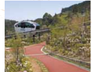
F-4 英彦山花園 (添田町) 総面積17000平方メートルの広大な敷地にシャクナゲ5000本、高山植物などを中心に70種類以上、32000本の花が訪れる人を楽しませます。