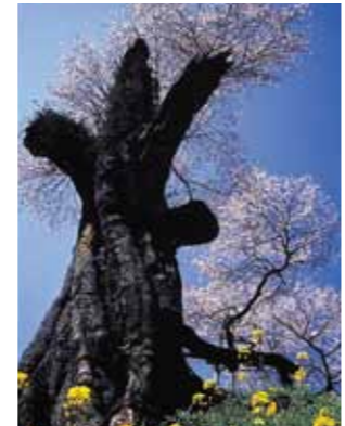
G-4 吉木のヤマザクラ (添田町) 幹周り4.6m、高さ16mの県下でも最大級のヤマザクラ。大きく伸びた枝に爛漫と咲き誇ります。