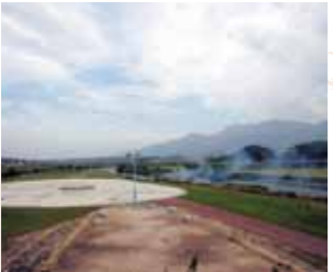
B-2 彦山川・中元寺川自然公園 (福智町) 菜の花や水鳥のさえずりなど、河川敷の自然を全身で感じることができます。