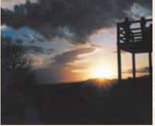
C-4 戸城山森林公園 (赤村) 戸代城跡が残る山頂に、展望台やアスレチック施設があります。眺望がすばらしく、遠くは英彦山・周防灘も望めます。