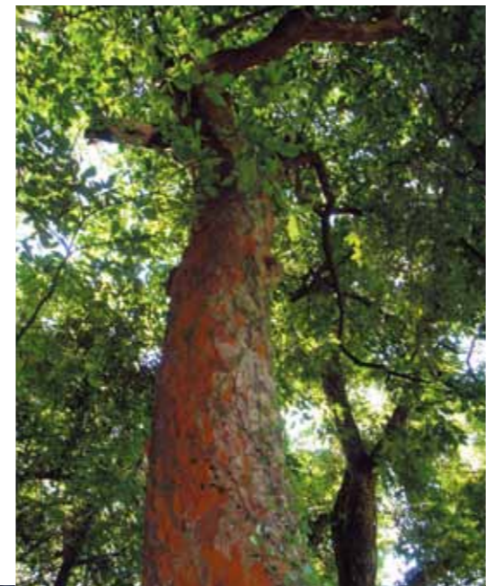
B-3 夏吉のバクチノ木 (田川市) 市指定天然記念物 バラ科の常緑高木で、9月頃に白い花を咲かせます。うろこ状になった小判大の樹皮が剥がれ落ちる様子が、「ばくちに負けて身ぐるみはがれる」ことに似ていることから、この名がついたといわれる。県内でも珍しい存在です。