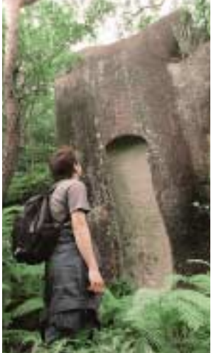
不思議な形にくり抜かれた 自然の造形・弘法岩