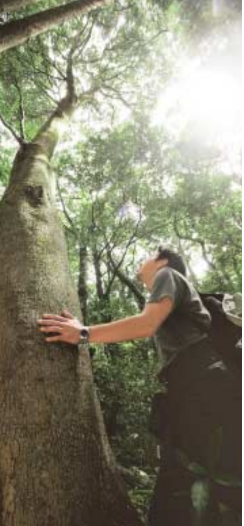
大木に遭遇。自然の偉大さを感じます。