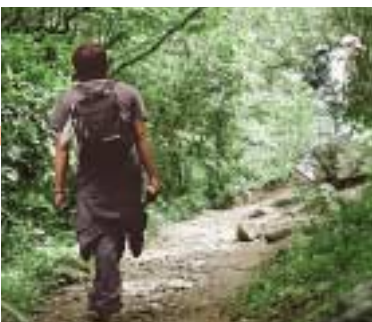
山道を散策しながら登っていきます。

四季折々に見える自然の景観 も美しく、たくさん登山家や、 ハイキングの人が訪れる、福智 町の人気の登山スポットです。