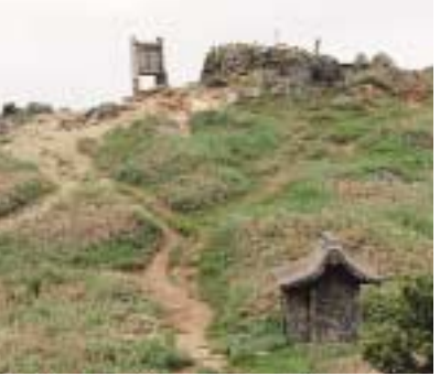
もうすぐ山頂です。やっとここまでできました。