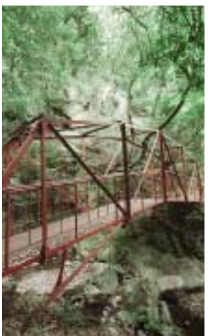
登山口付近で見つけた かじか橋